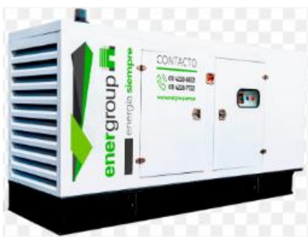
Modelo: Energgroup Motor FAWDE Modelo: DPK-DFAW-66 Potencia:48KW

-Las imágenes son solamente a modo ilustrativas-